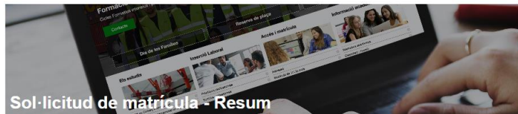
Sol·licitud de matrícula - Resum

Centre de Formació Professional Fundació UAB