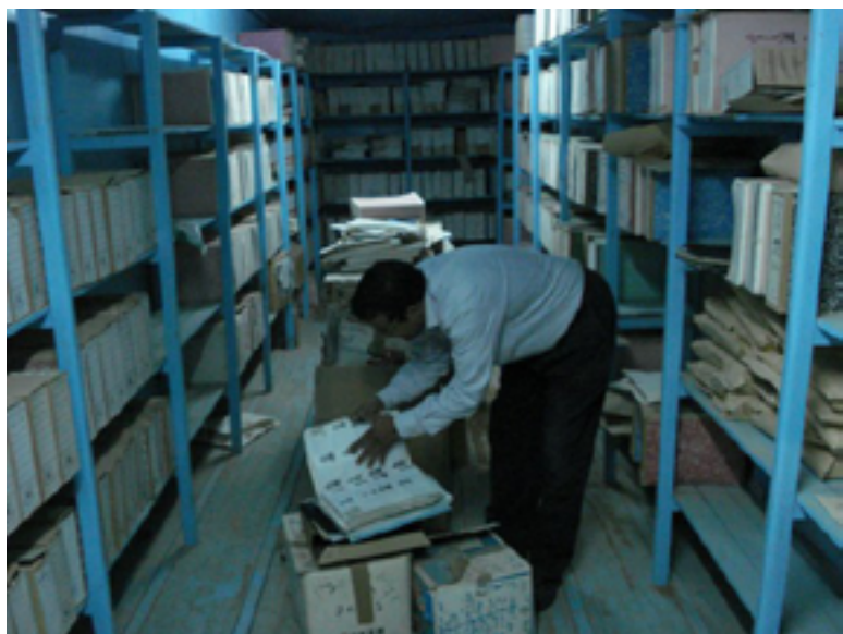
Il·lustració 4. Tècnic de l'Arxiu Nacional Sahrauí identificant i discernint els fons documentals.

funcionament dels arxius i del sistema associatiu i institucional de la societat occidental, que probablement no encaixa amb allò que ells detecten que és important. I a això se li suma les mancances materials de l'arxiu i de l'entorn, perquè tampoc disposen de les eines, els programes o la infraestructura adequada que els permetria donar compliment no només a aquests requisits, sinó també a implementar tècniques arxivístiques tant sobre la documentació en paper com en la seva digitalització.