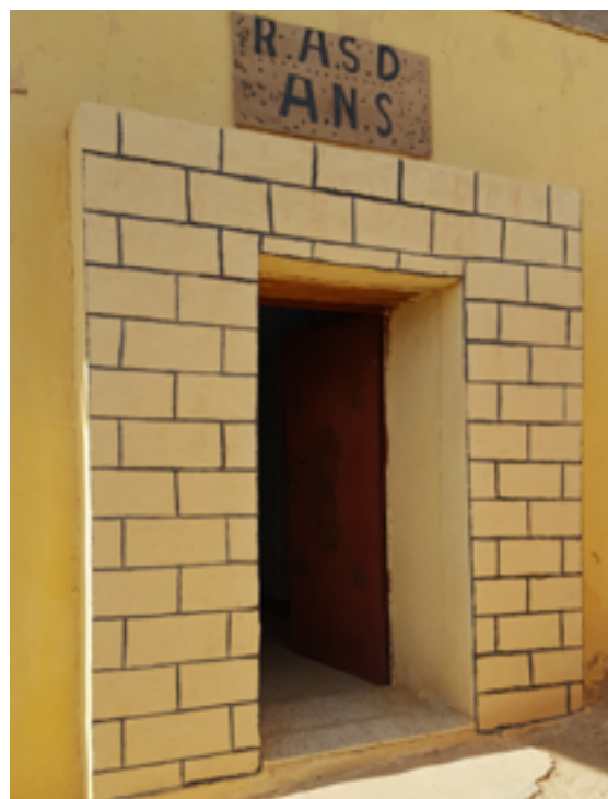
Il·lustració 2. Entrada a l'Arxiu Nacional Sahrauí.

d'algunes reflexions i apreciacions. El personal que hi ha anat treballant al llarg dels anys, tècnics i auxiliars, no és fix ni disposa de formació en arxivística o humanística, excepte el seu primer director tècnic. A més, s'ha experimentat una elevada rotació i substitució de personal al llarg dels anys, fet que ha dificultat les actuacions impulsades en el projecte.