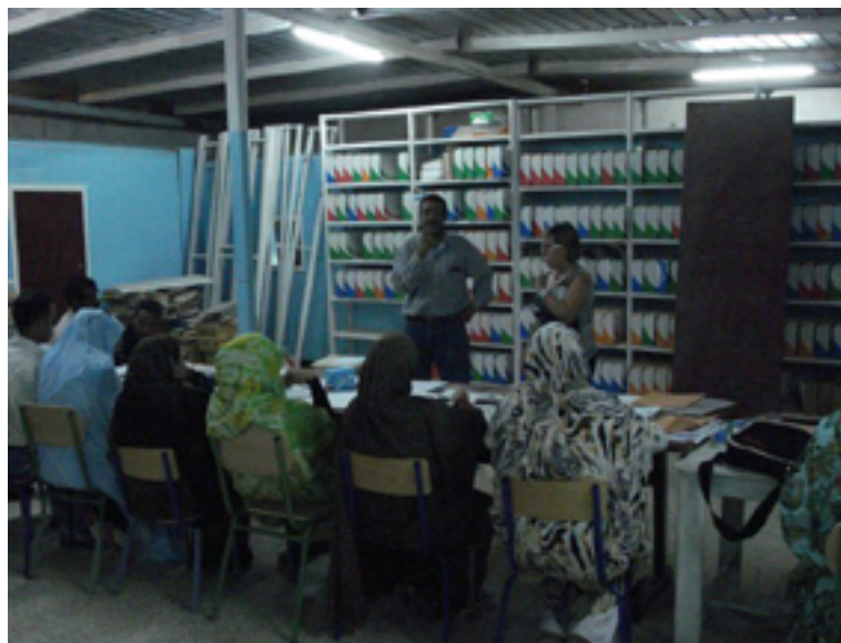
Il·lustració 3. Primeres formacions a l'Arxiu Nacional Sagrauí.

La seva experiència sobre el terreny va demostrar que l'estudi de prospecció no havia contemplat o no havia tingut accés a alguna informació que resultà clau pel projecte, especialment per aquelles primeres jornades formatives. Per exemple, aparentment, al no poder veure de primera mà la documentació durant la fase de prospecció, van constatar amb sorpresa que la documentació es trobava majoritàriament en àrab, i no en espanyol, al contrari del que els havien informat des de l'arxiu, fet que va obstaculitzar el treball i la realització de les sessions pràctiques. Tampoc els/les alumnes que van assistir a les formacions entenien el castellà, de manera que van haver de sol·licitar amb urgència un servei de traducció de les classes i els