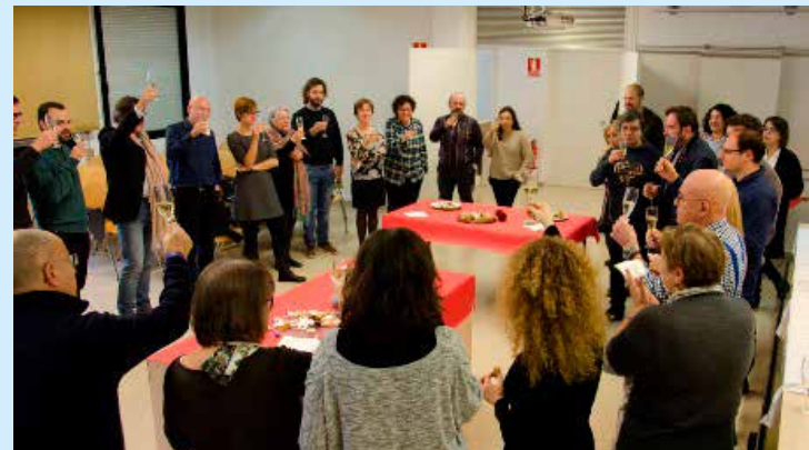
Desitjant-nos unes bones festes de Nadal