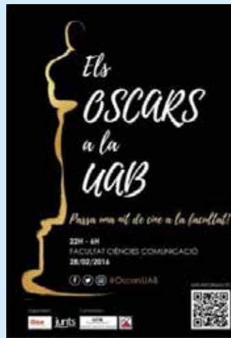
Cartell anunciador de la Primera Nit dels Oscar a la UAB