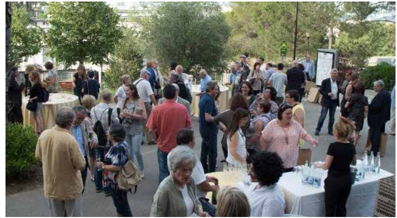
Celebració a la Rambla de la Comunicació amb els jubilats i familiars

Juntes de Facultat, quatre ordinàries (febrer, maig, juny i desembre) i una extraordinària (novembre) per debatre el document d'Escenaris de reforma dels Plans d'Estudis. També s'ha reunit la Comissió d'Afers Acadèmics, la Comissió de Màsters, la Comissió d'Economia i la Comissió de Seguiment.