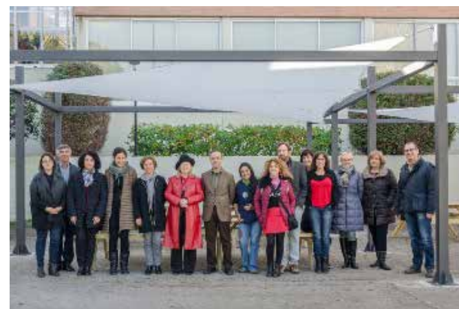
Inauguració d'Es Tendal, nou espai de convivència a l'aire lliure, a la Rambla de la Comunicació

nombre creixent d'estudiants, el que fa possible una experiència docent singular que es materialitza en la consolidació i ampliació de les programacions de UABtv i UABràdio, que ja és membre de l'ARU (Associació de Ràdios Universitàries d'Espanya).