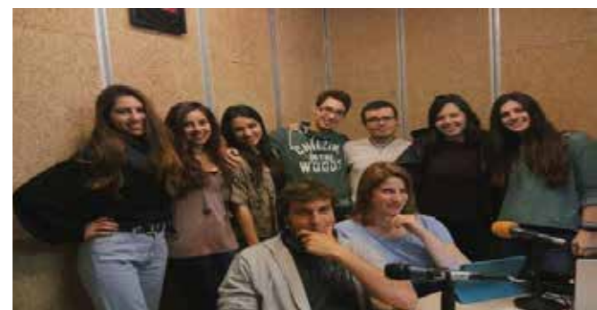
Alguns dels estudiants que integren la redacció UAB Campus Mèdia