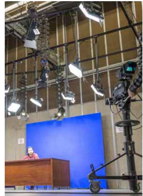
Plató televisió (vertical)

Al llarg del primer semestre, la Junta de Facultat va discutir i aprovar una normativa de revaluació i una altra de revisió extraordinària de la qualificació final. Això va portar a ajustar les guies docents del curs 2016-2017 a les noves indicacions. La més destacada va ser, possiblement, la que especificava que els alumnes que havien participat de l'avaluació continuada i suspènia l'examen final ordinari podrien reavaluar-se d'aquest examen sempre que haguessin obtingut una nota mínima de 3 punts i que haguessin anat a la revisió ordinària d'aquest examen.