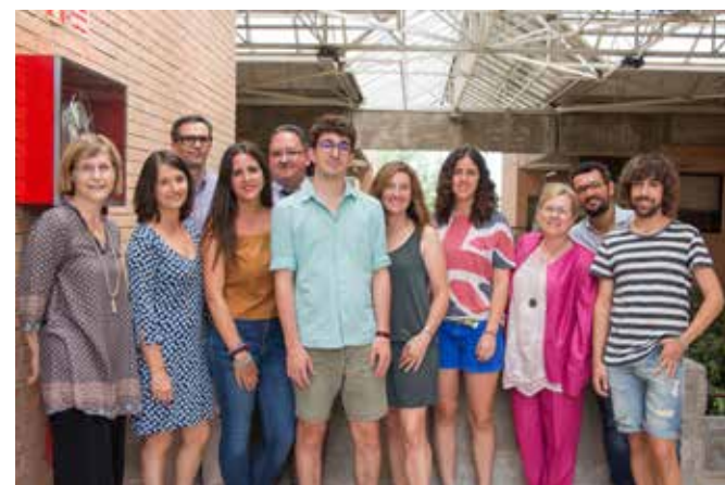
Participants en la primera edició del Premio Mañana d'A3 Media