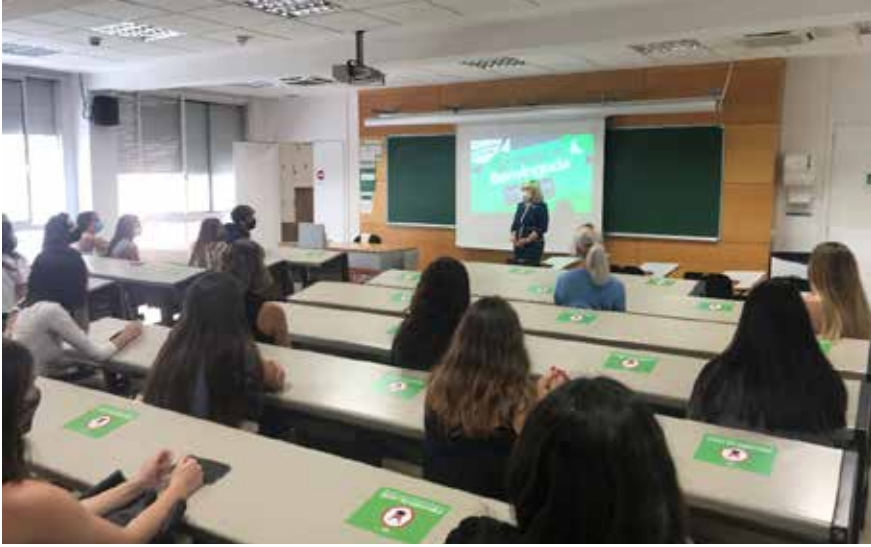
Sessions de les Jornades de benvinguda del curs 2020-21 a les aules de la FCC