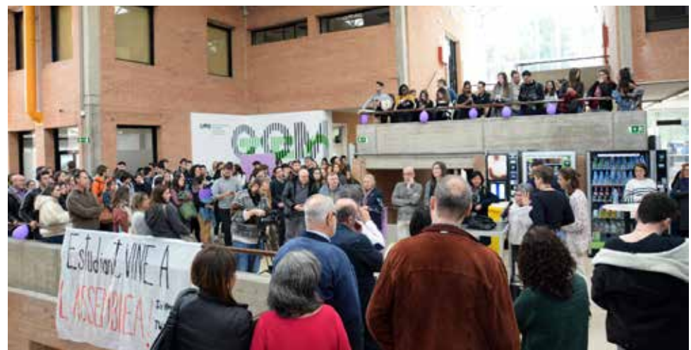
Activitat per commemorar el Dia de la dona al hall de la FCC