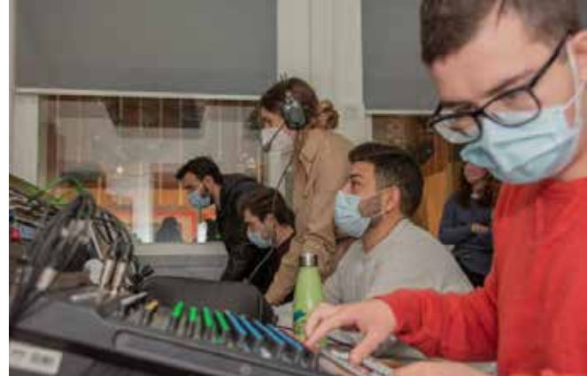
Activitats acadèmiques als diversos espais de la facultat

Res no ha estat fàcil i potser mai més viurem la vida que teníem abans del març de 2020. Però lluitarem per recuperar al màxim la normalitat. Per a què els estudiants que van acabar els