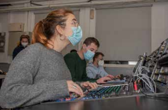
Activitats acadèmiques als diversos espais de la facultat