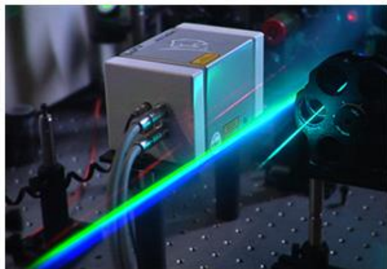
Una universitat que fomenta la innovació i l'emprenedoria