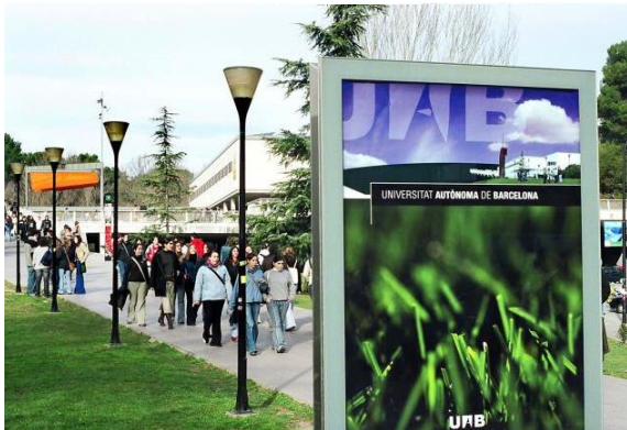
Un campus internacional saludable i sostenible