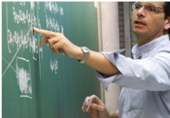
Una docència de qualitat