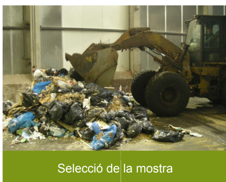
Selecció de la mostra