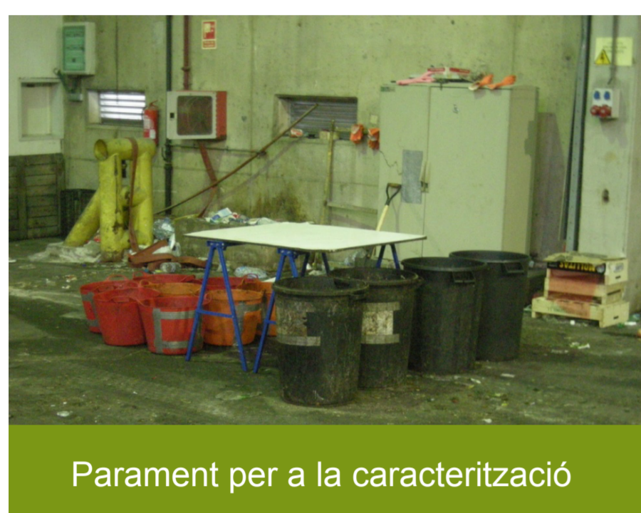
Parament per a la caracterització