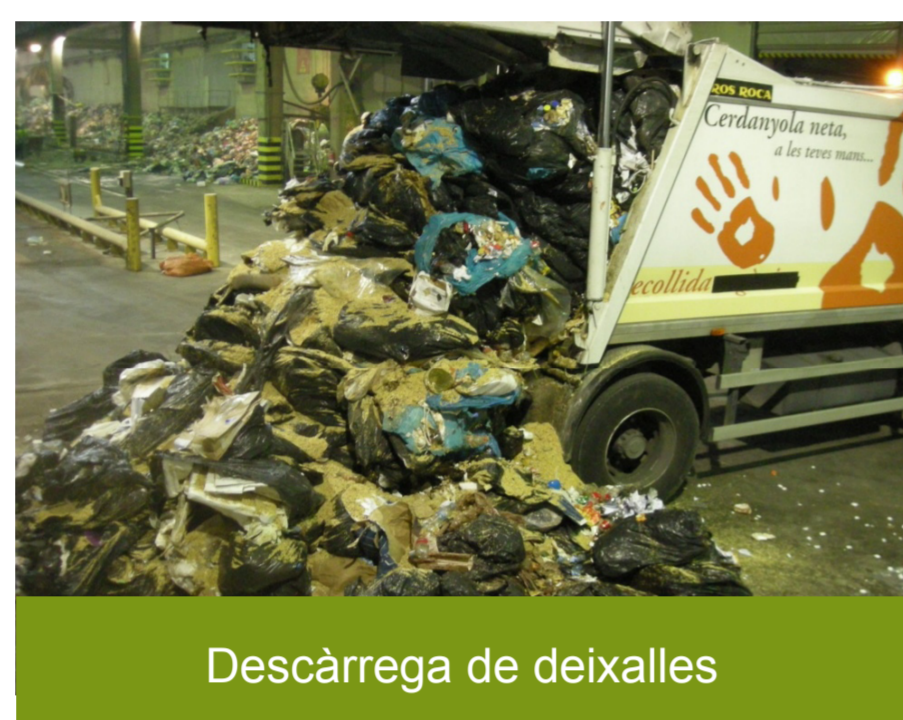
Descàrrega de deixalles