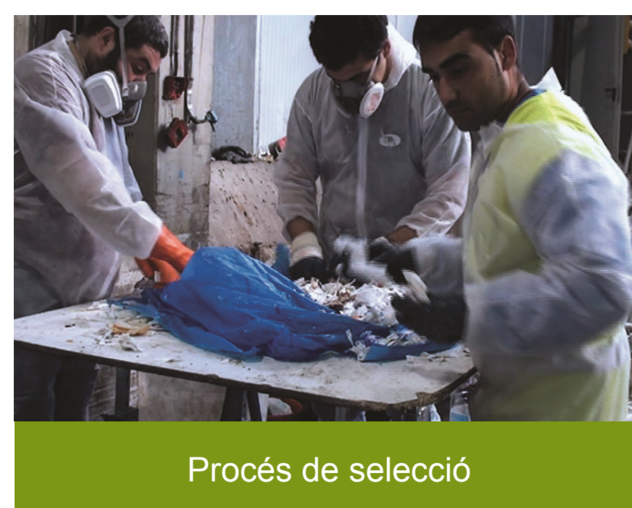
Procés de selecció