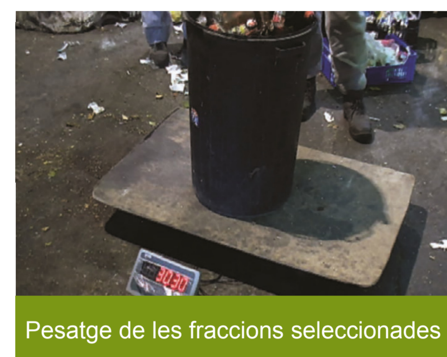
Pesatge de les fraccions seleccionades