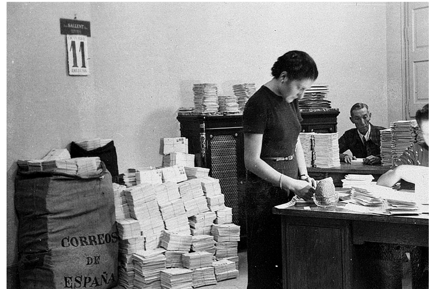
A pàgines anteriors, exemplars del Journal de Barcelone . Sobre aquestes línies, oficina del Comissariat de Propaganda, a Barcelona, amb els butlletins d'aquest organisme, que s'editaven en català, castellà, francès, anglès, alemany i italià, entre altres idiomes. (Arxiu Nacional de Catalunya - Comissariat de Propaganda).

llegir: “ Le Journal de Barcelone ne sera pas un journal de plus, sinon une feuille modeste et véridique ” ( El Journal de Barcelone no serà un altre diari, sinó un full modest i veritable ). En el número 68, Miravittles escriu l'article “ Deux peuples frères. Catalogne et France ” ( Dos pobles agermanats. Catalunya i França ) en què exposa els lligams republicans espanyols i l'amistat francocatalana.