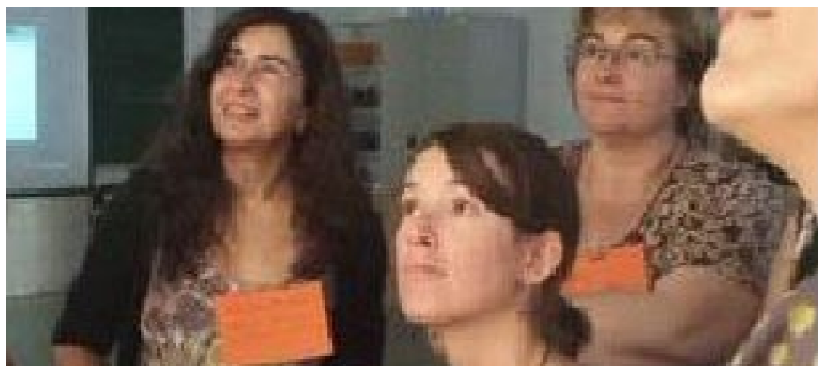
Escoltar, entendre, esperar i deixar-se sorprendre