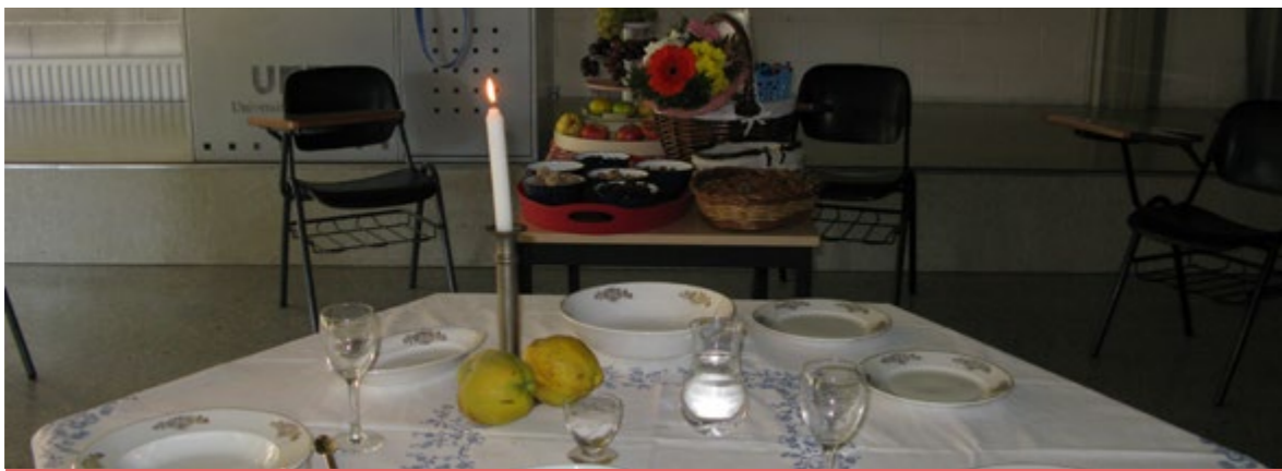
La taula parada