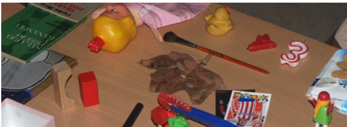
Objectes que ens transporten a altres temps!