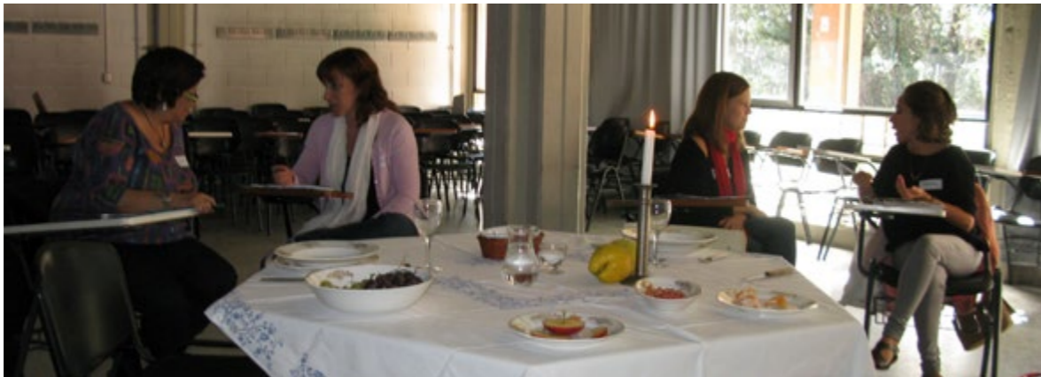
Conversa al voltant de la taula