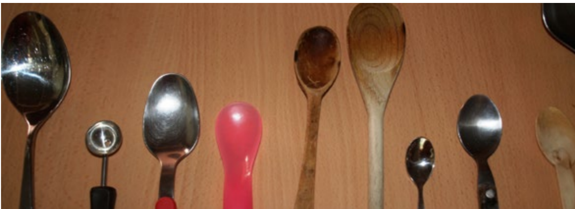
La col·lecció de culleres com a metàfora d'un estri que s'adapta al pas del temps, però sense perdre la seva funcionalitat!