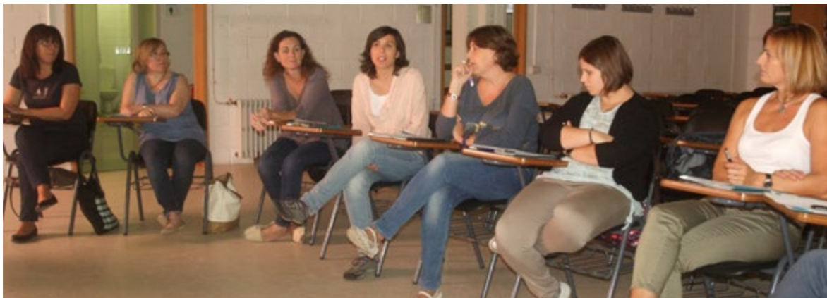
Iniciant-nos em el tema d' "educar per avui, educar per demà"