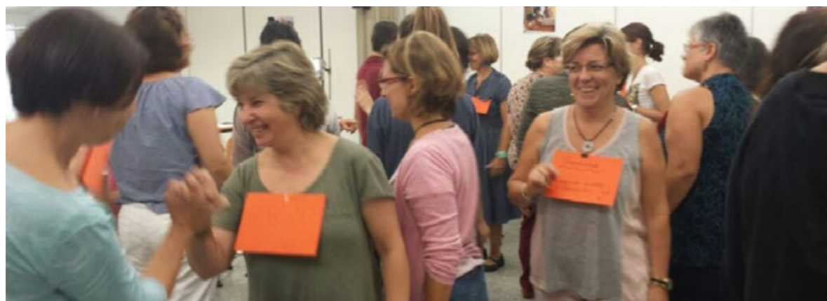
Trobar-se i conèixer-se

Sobre el repte del temps que tots tenim es proposa ser-hi presents. Presència en el sentit de ser-hi d'una manera autèntica. Si es té plena consciència de ser-hi, es té temps!