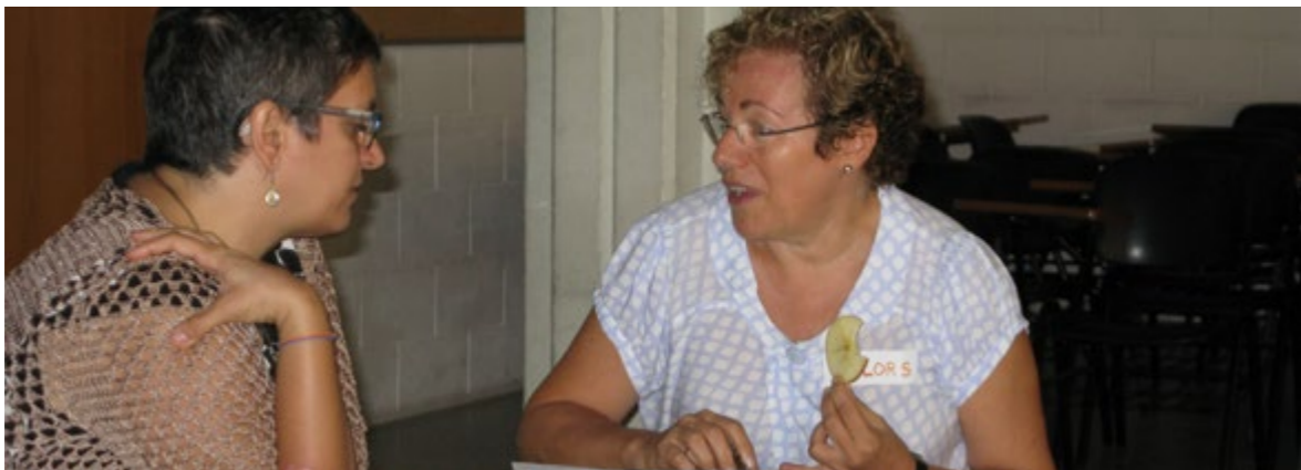
Compartint ingredients, preparacions i presentacions