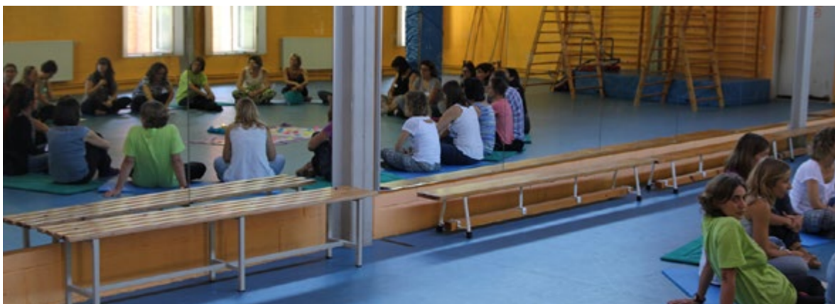
Sobre estimular sovint implica rigidesa i poc ajustament a les necessitats individuals

El conjunt de mestres tenim un paper important i bàsic per al creixement dels infants en la progressiva conquesta de l'activitat autònoma.