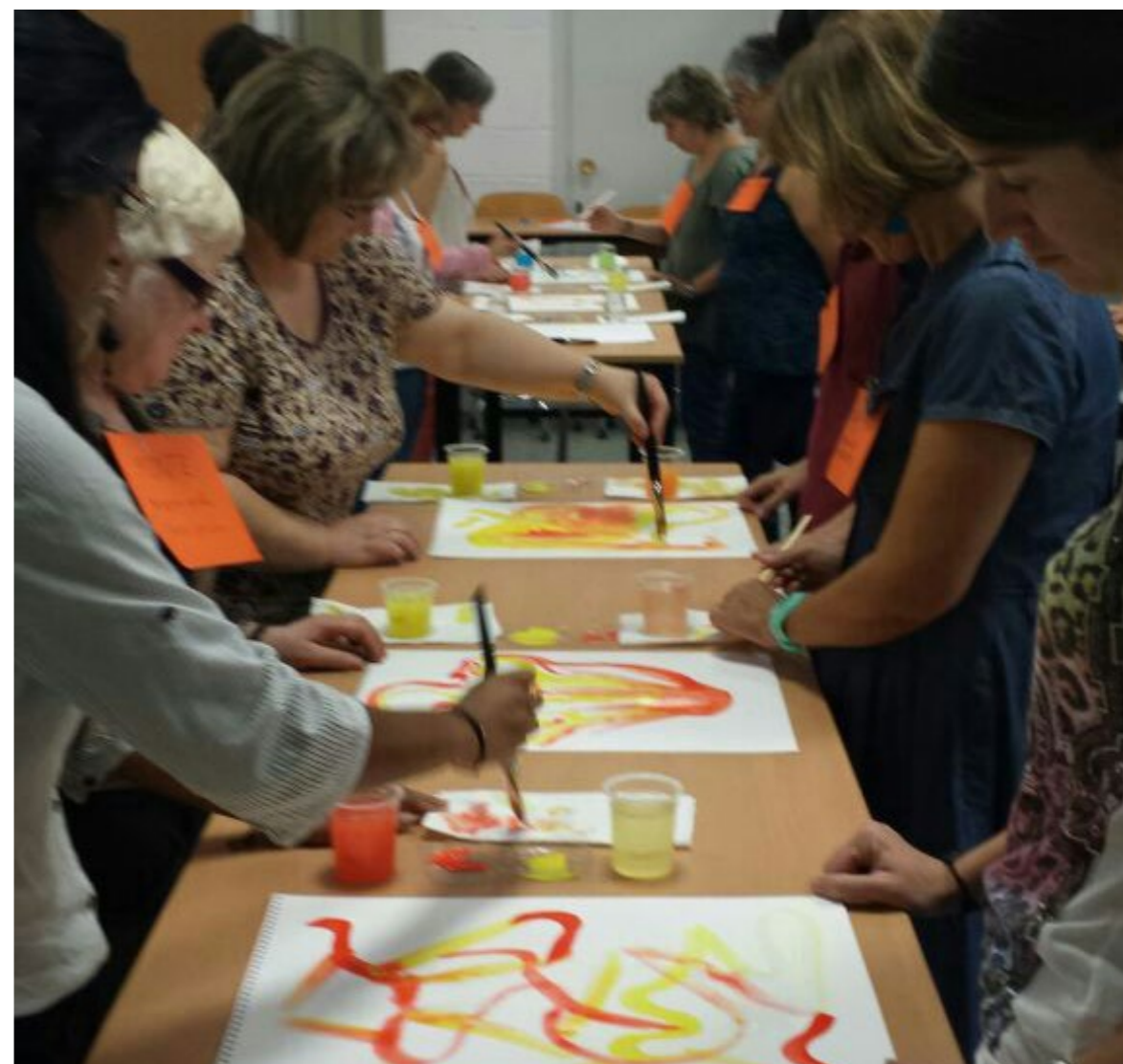
Concentració física, emocional i mental per construir conjuntament