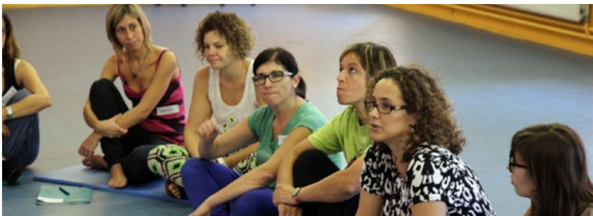
La simultaneïtat de les propostes ofereix atenció diversificada i en grup reduït