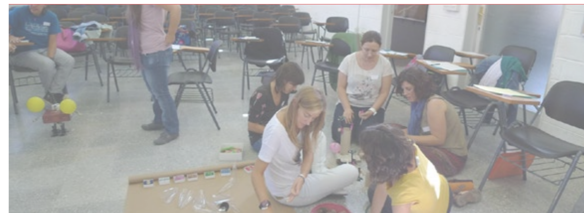
Treball dels grups per a la construcció de l'animal que representa les jornades.