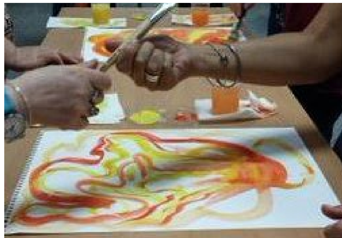
El respecte per l'altre en els cicles de donar i rebre, de fer i esperar, de parlar i escoltar