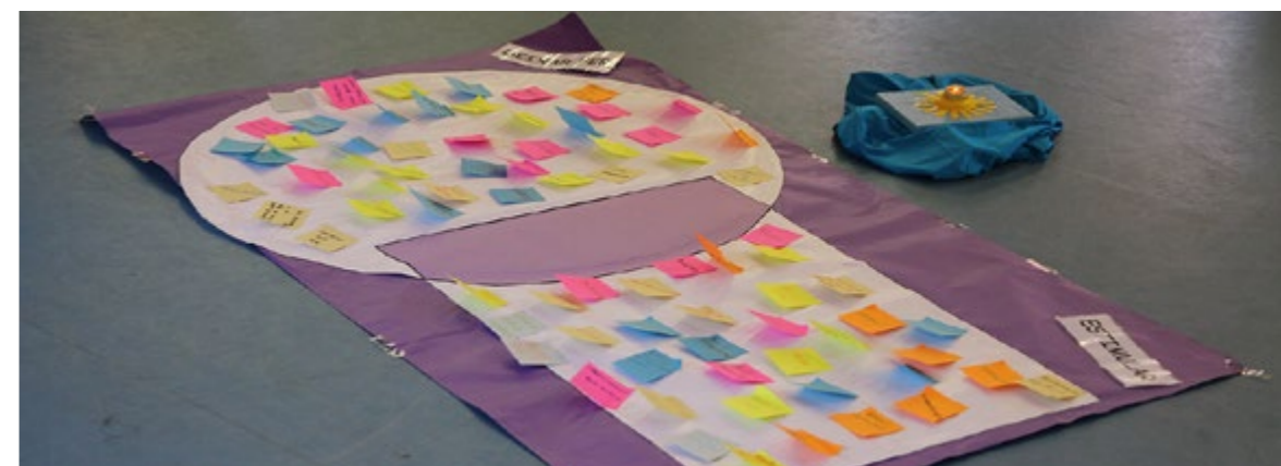
La metodologia que fem servir, genera emocions que afavoreixen o entorpeixen l'aprenentatge