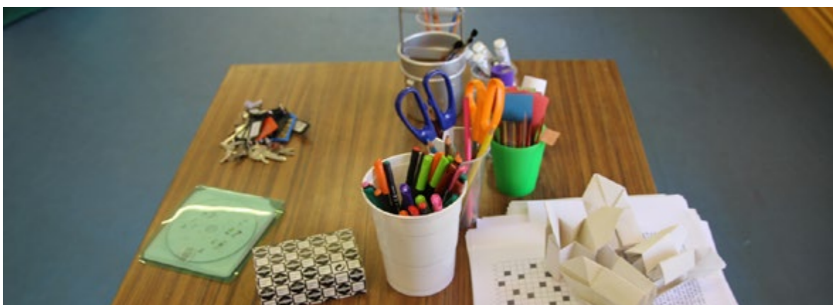
Deixar fer en un ambient divers afavoreix la motivació dels infants