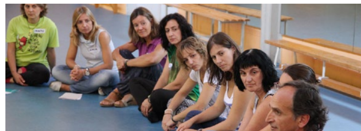
Les activitats molt estructurades sovint dificulten la motivació i l'ajustament a les necessitats i coneixements dels infants