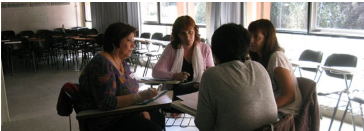
Contrastant els nutrients