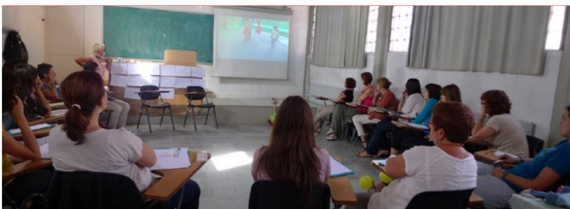
Visionat d'una experiència grupal de dansa d'infants de 3 anys a l'escola El Puig

Hem constatat que l'ús de materials diferents, estranys i atípics a l'aula, excita la creativitat. A l'escola infantil, la possibilitat de crear amb volum aporta moltes pistes de com està emocionalment l'infant.