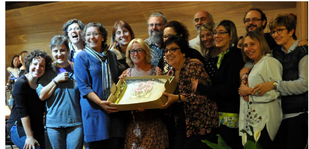
Moment de la celebració del 25è aniversari