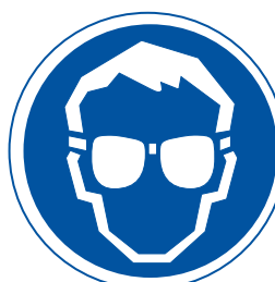
Obligatori l'ús d'ulleres