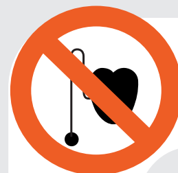
Prohibit el pas amb marcapassos