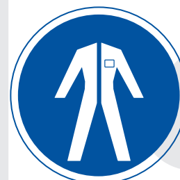
Protecció obligatòria del cos