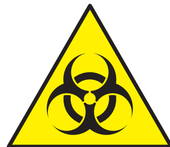
Senyal de risc biològic

A la UAB, la gestió relativa a la bioseguretat es porta a terme de forma coordinada entre el Servei de Prevenció i l'Oficina de Medi Ambient (OMA, tel. 93 581 34 80).