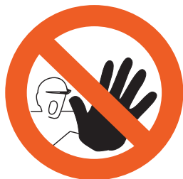
Prohibit el pas sense autorització

Un senyal que prohibeix un comportament susceptible de provocar un perill. Alguns exemples: