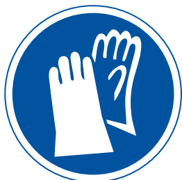
Obligatori l'ús de guants

Un senyal que obliga a un comportament determinat.