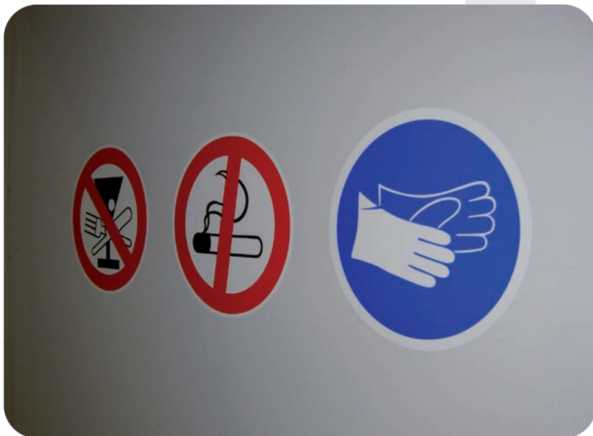
Exemples de retolació de seguretat en instal·lacions.

Els pictogrames són símbols internacionals que comuniquen informacions elementals mitjançant un codi de formes, colors i figures.