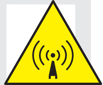
Senyal de risc de radiacions no ionitzants

Si teniu cap tipus de consulta no dubteu a posar-vos amb contacte amb el Servei de Prevenció