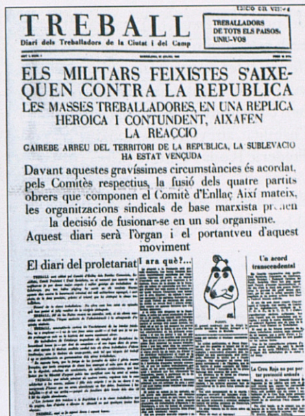
Portada d'un exemplar de Treball , òrgan d'expressió clandestí del PSUC.

libertad entendida al estilo democrático había ocasionado a una masa de lectores diariamente envenenada por una Prensa sectaria y antinacional” s’havien d’evitar i que no tornés mai més el “libertinaje de