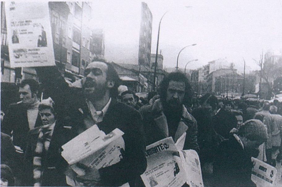
Venedors del diari il·legalitzat El Combate , que formava part de l'exposició "Letras Clandestinas 1939-1976", que l'any passat es va poder veure a Madrid.

franquista editaren, a l'interior o des de l'estranger, publicacions com a signe d'identitat, vehicle de propaganda i alhora, també, com a element formatiu i informatiu.