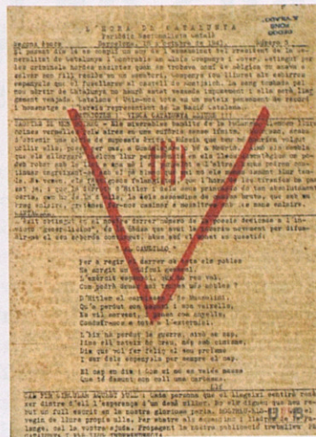
Alguns exemplars de premsa clandestina d'ideologia catalanista i de formacions d'esquerrres que es van publicar durant el franquisme i la Guerra Civil: L'Espurna (1937), Mundo Obrero (1963) i L'Hora de Catalunya (1941).

de publicar un full clandestí representava l'expressió de la ruptura del consens i la uniformitat en el nou Estat. Aparèixer