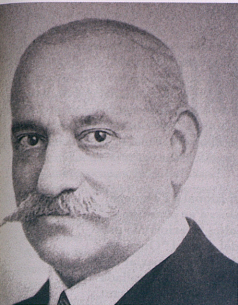
Pere Coromines va ser el director d' El Poble Català entre els anys 1909 i 1916.